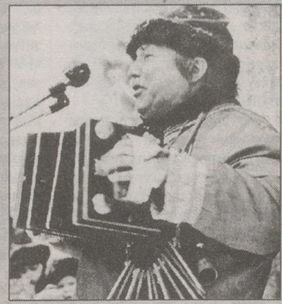
В воскресенье около Березового домика было организовано народное гуляние "Зимние забавы". Горожане веселились, несмотря на ненастную погоду. Возможностей проявить себя было много. Можно было покататься на лошади и... с горки, а также на деревянном коньке. Словом, каждый выбирал себе развлечение сам.